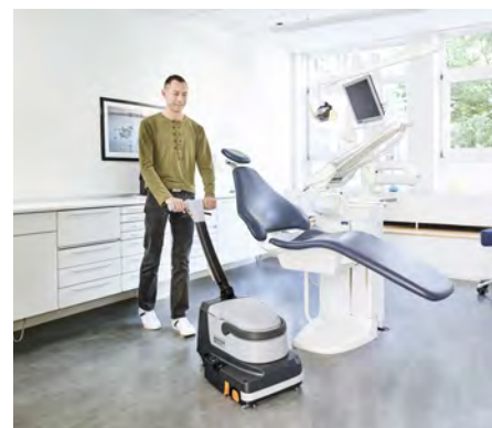
Koneen pesuteho on erinomainen käsimenetelmiin verrattuna.