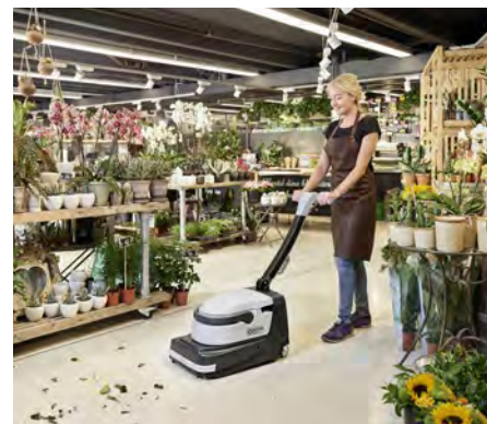
Helppoa ja nopeaa lattioiden puhdistusta - lakaisee, pesee ja kuivaa yhdellä ajolla