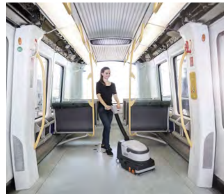
Helppo liikutella kääntyvien pyörien ja ergonomisen säädettävän kahvan ansiosta